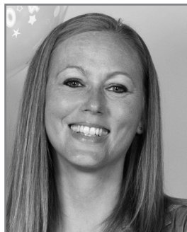
Ils Camps Carla