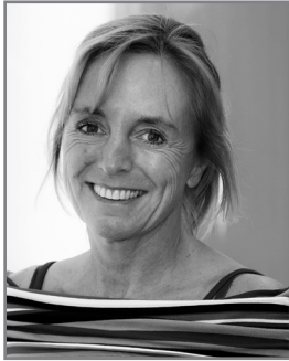
An Swartenbroekx Regie