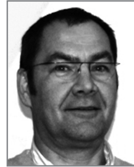
Johan Buntinx Decor, techniek & fotografie