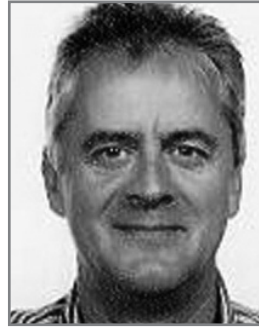
Luc Verlinden Decor & techniek